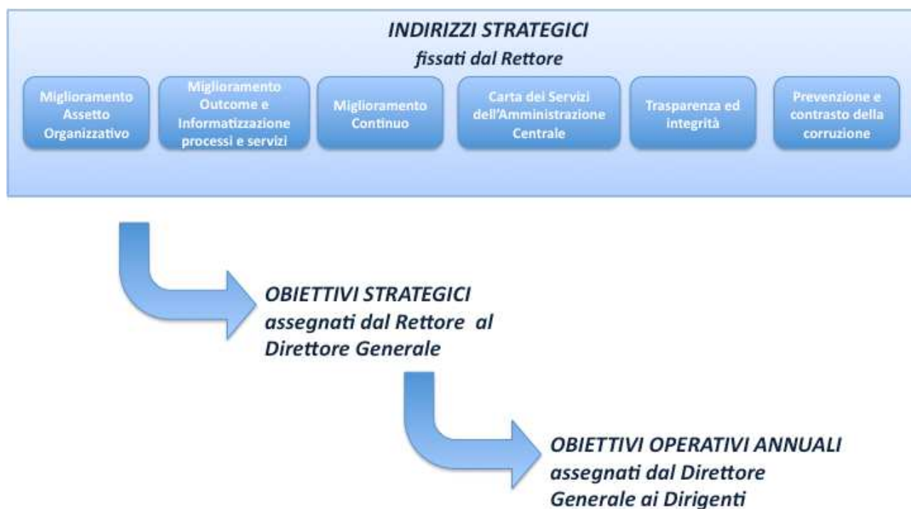
Figura 1: Cascading nella valutazione della Performance Organizzativa

Anche nel presente piano della Performance, applicando il concetto di cascading (figura 1), nell'ambito degli indirizzi strategici sopra menzionati, il Rettore definisce gli obiettivi strategici triennali assegnati al Direttore Generale con relativi target ed indicatori. Il Direttore Generale, di concerto con i Dirigenti, declina tali obiettivi strategici in obiettivi operativi annuali, anch'essi con target, indicatori e responsabile del conseguimento dell'obiettivo operativo in parola.